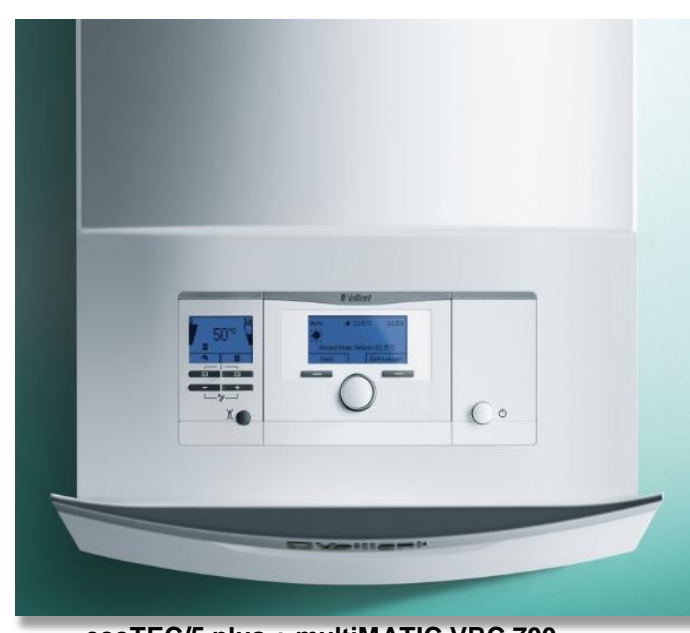
ecoTEC/5 plus + multiMATIC VRC 700