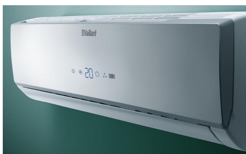
climaVAIR VAI 3