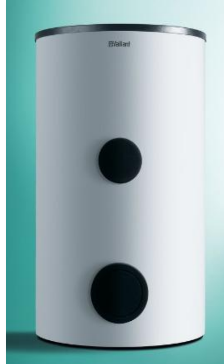
VIH RW 400 B