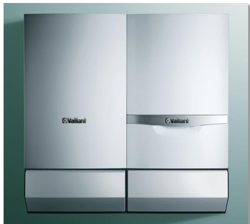
VU+VIH QL 75 B