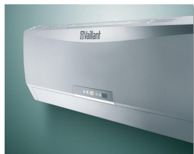
climaVAIR VAI 6